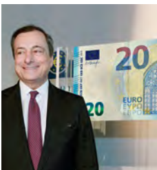
Mario Draghi President, Bank Ċentrali Ewropew

Minn meta daħlu fl-2002, il-karti tal-euro saru wieħed mill-mezzi ta' hlas l-aktar fdati fid-dinja u huma simbolu b'saħħtu tal-integrazzjoni Ewropea. Illum l-euro hija l-munita ta' 19-il pajjiż u 338 miljun ċittadin Ewropew. Dmirna hu li nżommu din il-fiduċja billi ninkorporaw l-aħħar teknoloġija fil-karti tal-flus u hekk inkomplunsaħħu s-sigurtà tagħhom.